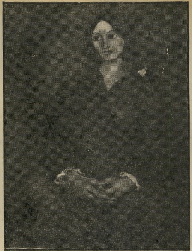
"נערה יושבת" של סיאני חיוניות פלוס כישרון

אמנות הישראלית שמור לה, אך מילחמתה השקטה למען ארץ יפה היא צד נוסף בעולמה של אמנית רגישה ומעולה זו. את פירות עבודתה ניתן לראות גם בתל-אביב וגם בירושלים. מומלץ.