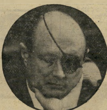
משה דיין מתחילן

ל רשימים אפשריים אחרים לד"ש הם קבוצה שהתעוררה מחדש - קבוצת הגנרלים. קל לזהות את האנשים שהצטרפו למפק"ל המודח של המישטרה, הרצל שפיר, במאבקן "להצלת המדינה". קל גם להבחין מי מכשיל את שפיר שואף-הנאקם בעצות טקטיות מטופשות, כפירסום הטלפון נים החסויים של השרים. את האלופים שהצטרפו אל שפיר אפי שר היה למצוא ליד מוטי אשכנזי, ואחרי שזה פשט את הרגל, ליד ייגאל דיין. ה"גנרלים אהרון יריב, אברהם ("צ'יטה") בוצר, צביקה זמיר, יוחאי בן-גורן ונתקה גיר (ראה עמוד 33) תפסו טרמפ על שפיר, והם מגלגלים בינם לבין עצמם את הלום הכוח הפוליטי ואת הלום הנסיון הנוסף של הרפתקת ד"ש. יש להניח שחלק מהם יירתע בזמן. גלי אהדת הרחוב לשפיר ולאותם המצוטפים סביבו מתחילים להרגע. אך הגנרלים ש"יישאו עולמים לסבך את שפיר ולהשיג תמס בו כבדגל לרשימה פוליטית שתקום להציל את המדינה, גם מהליכוד, גם מהמערך ובעיקר מהמפד"ל - רשימה ש"ספק אם תעבור את אחוז החסימה.