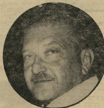
עזר וייצמן מחטט