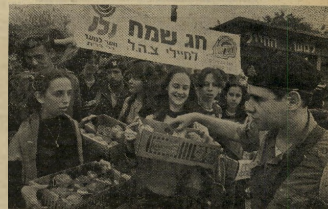
בני-נוער החברים ב"נוער לנוער" חילקו בימי החנוכה סופגניות בתחנות-ההסעה לחיילים, במבצע של "עד 18", חוג הצעירים בדיסקונט