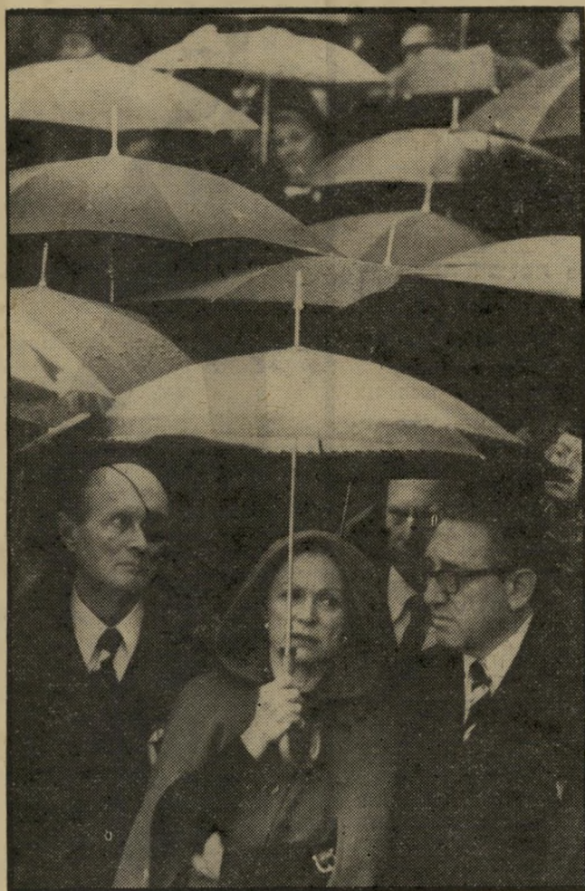
לשעבר קיסניגר (עם רחל ומושה דיין) מדראמה לקומדיה

היתה זאת שיטה. הוא טיפל רק בעניינים שהתאימו לעיצוב דרמא-