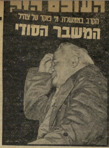
"העולם הזה" 951 תאריך: 5.1.1956

השבוע לפני 25 שנה ערכו כתבי וצלמי "העולם הזה" מישאל-חיצות כדבר דמותה של צברית 1956. בשער הגיליון: ראשיה-ממשלה ושרי-הביטחון דויד בן-גוריון.