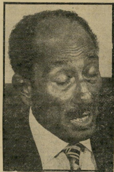
נשיא ארסאדאת — "ארסאמדי" הודח

הסורים, אלא את מקורות העושר הערבי בכל חצי האי ערב. היתה רק בעייה אחת: אפשר היה להגיר שים יומרות אלה רק בעזרת סיוע סובייטי טי מאסיבי, הן כדי שיוספקו אמצעי-הלחרי מה לצורך הכיבושים, הן כדי להדוף כל