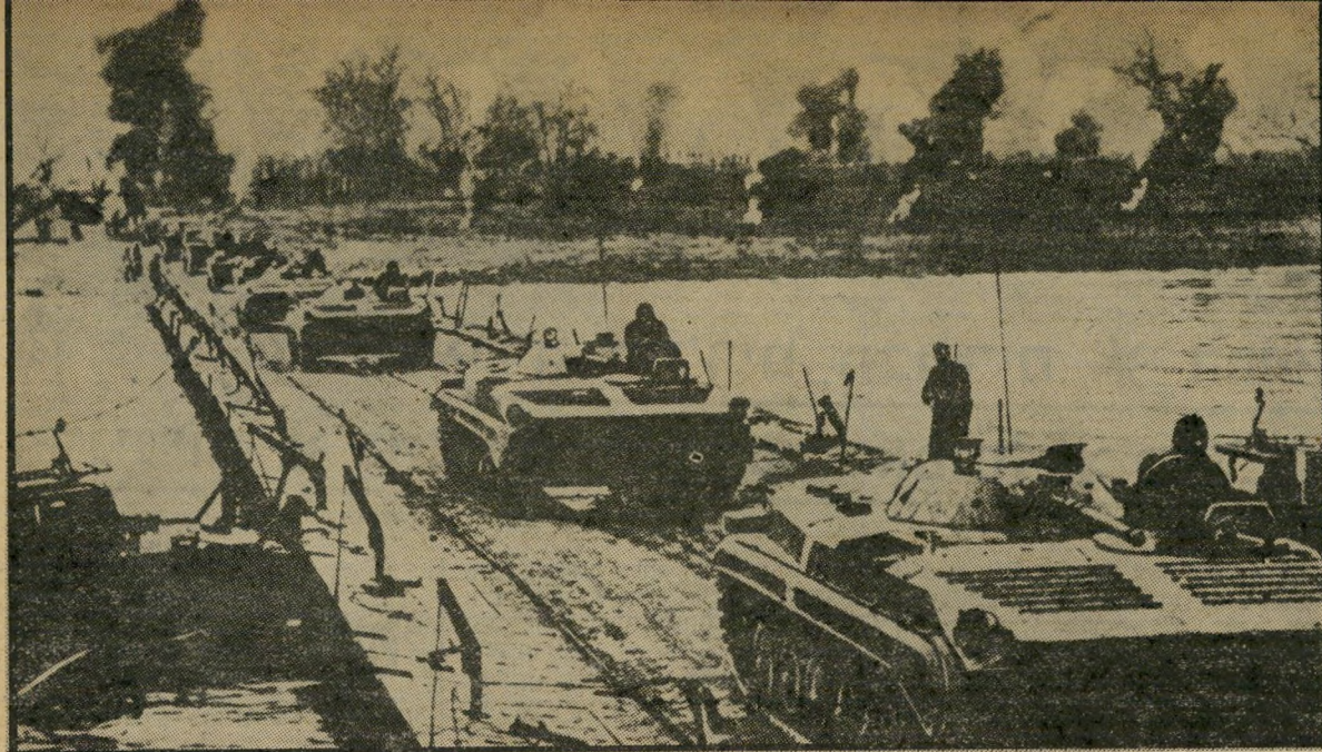
שיריון סובייטי הוצה את נהר הויוור בגרמניה בליץ קריג סובייטי

לונג פארוק • שרד ונשאר על כנו. רוב המדינות שבהן ניסה להתערב, ושנתת משטרתיו ניסה לחתור, ניערו אותו מעליהן. תמיד חיפש צרות, אך מעולם לא אחז בנשק. תמיד איים והפחיד, אך מעולם לא פעל. מעולם לא היה במלחמה, אך אף פעם אחת לא היה מחויף לה. "כל זה היה קשור במה שקרה במצריים. מזה זמן רב שאף הנשיא, חסן אל-סאמדי לכך שתהיה לו שליטה בחצי רות ממגניו — ערביה הסעודית ומדינות הנפט העשירות במפרץ. לא היה זה הוא, אלא יורשיו, שהצליחו להשיג זאת. כאשר