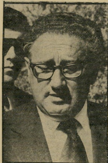
שרי החוץ לשעבר קיסנינג'ר הגיש דו"ח

פיק, מצידו, זכה בתמיכתם הנלהבת של היסודות הצעירים יותר בכוחות המזוינים ובשירותי המודיעין. האחרונים, שהשתחררו מהרסן שכפתה עליהם הממשלה הי קודמת, הגישו תוכניות יומרניות ליצירת רפובליקה ערבית מאוחדת-רבתי, אשר תכ לול, הפעם, לא רק את הלובים או את