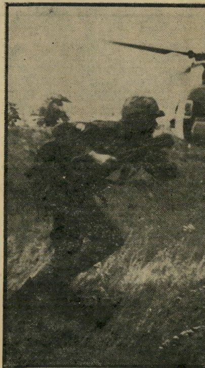
חייל אמריקאי נחם שיחרור ברמן

לונג פארוק • שרד ונשאר על כנו. רוב המדינות שבהן ניסה להתערב, ושנתת משטרתיו ניסה לחתור, ניערו אותו מעליהן. תמיד חיפש צרות, אך מעולם לא אחז בנשק. תמיד איים והפחיד, אך מעולם לא פעל. מעולם לא היה במלחמה, אך אף פעם אחת לא היה מחויף לה. "כל זה היה קשור במה שקרה במצריים. מזה זמן רב שאף הנשיא, חסן אל-סאמדי לכך שתהיה לו שליטה בחצי רות ממגניו — ערביה הסעודית ומדינות הנפט העשירות במפרץ. לא היה זה הוא, אלא יורשיו, שהצליחו להשיג זאת. כאשר