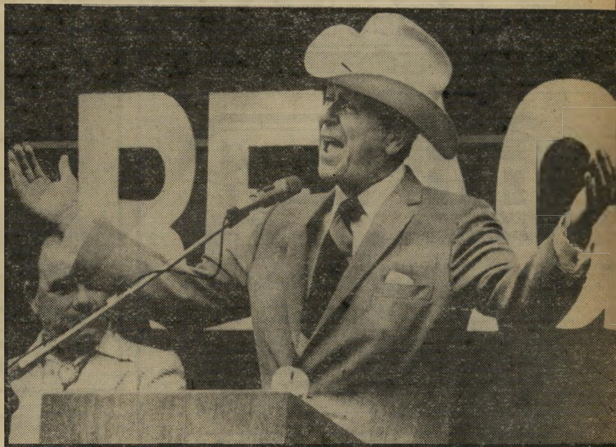
נשיא-שמרני מהדרום נבחר בארצות-הברית "תומפסון" - חסר כל מושג במדיניות-חוץ

"במיזרח התיכון: השגת שלום עם ישראל במסגרת הסכמי ועידת-ה-1973, במרוצת ימי נשיאתו של קרט, הניחה