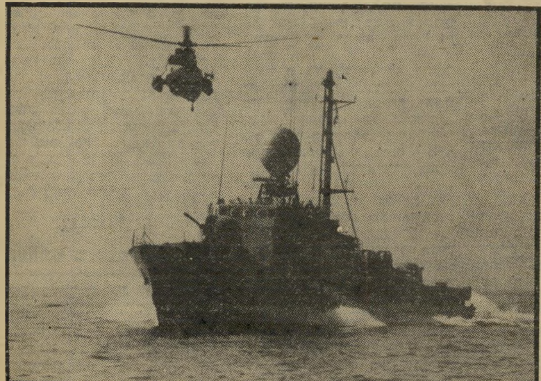
שיזוב כין-זרועי, ספינת מישמר מערבי-גרמנית ומסוק נחיתות בים

ל י שרת האירועים המתניעה את גלגלי מילחמת-העולם השלישית מת- הילה בפולין, עם בחירתו של הנשיא ה- אמריקאי החדש בנובמבר 1984. נשיא זה הוא שמרן ריפובליקאי, חסר כל מושג במדיניות-חוץ. תומפסון - זהו שמו של הנשיא החדש - זוכר כיצד הויקה לג'רלד פורד הערה שהשמיע במהלך מערכת-הבחירות שלו נגד ג'ימי קארטר ב-1976, ושממנה הש- מע כי ארצות-הברית לא תתערב כדי להגן על פולין, אם תותקף עלי-ידי ה-