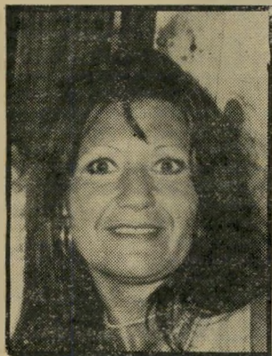
מציזת-כלבים אדווה כה לחי

תוכן הכתבה היכני בתדהמה. אכן, צודקת נעמי אדווה בכך ש-