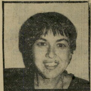
מצולמת מגדל היכן היו המצלמות?

ברכה שווארץ אמנם יותר זוהרת מצפי מגדל. אבל אם הייתם שו-