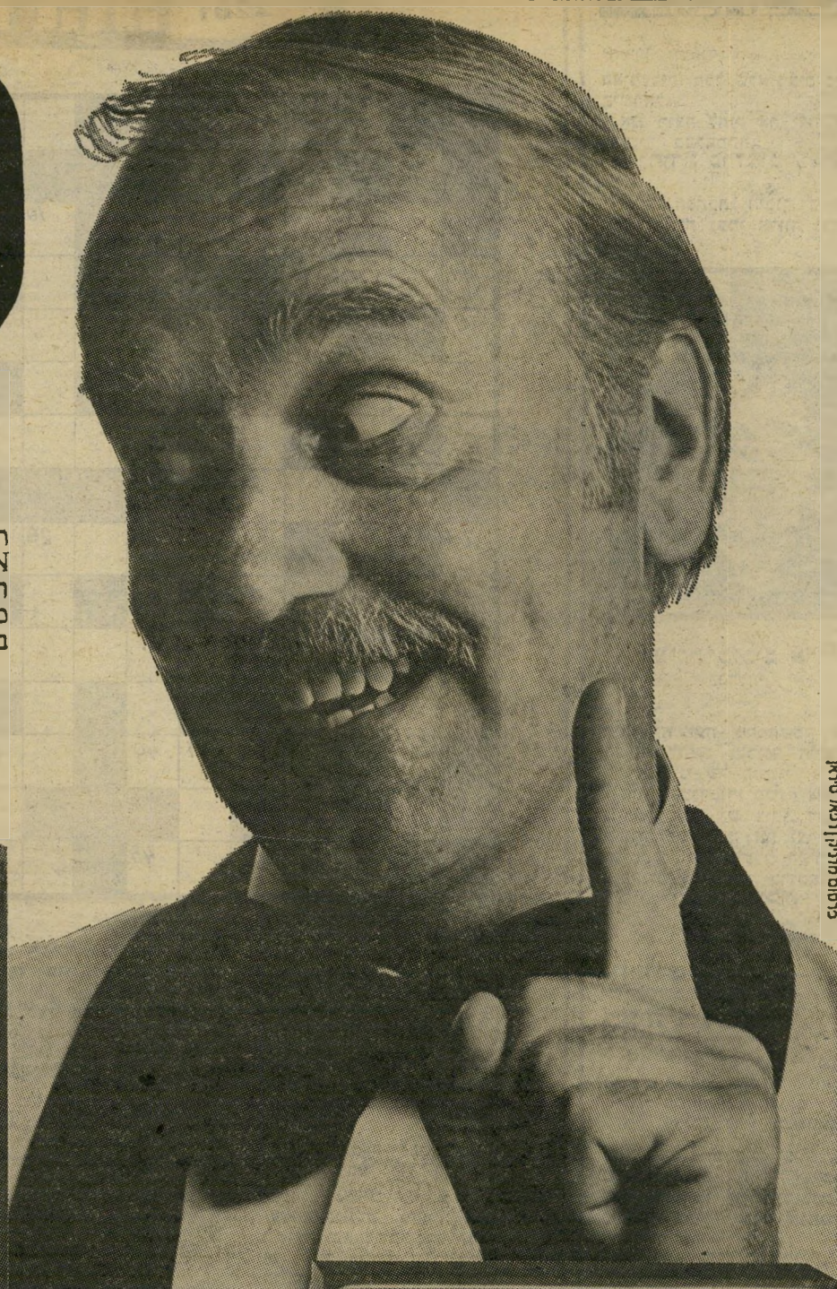
אריאל | ראיס | סטודיו

רק בטלוויזיות הציבעוניות של SONY תמצא את TRINITRON, השיטה הבלעדית המקרינה את התמונה בעזרת תותח חד-קנה וטכניקת מסך משוכללת, המאפשרת קבלת תמונה חדה ובעלת בהיקות גבוהה בצבעים טבעיים.