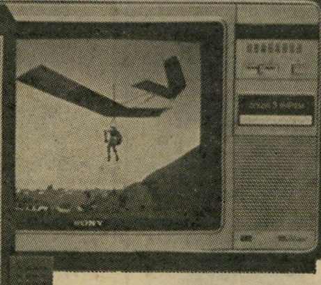
לבחירתך מספר דגמים חדישים בגודלים שונים: