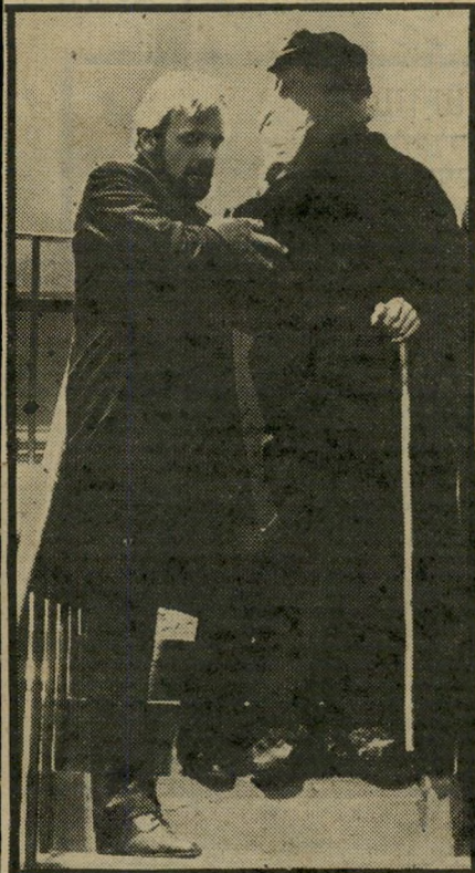
אנתוני הופקינס כד"ר טריבס ז"ר טריבס מאשפז את התגלית

לא לגלות. אין טעם לדון עתה בהבי-דלים שבין גישת המחזה, שלא ירד מעל-בימות ברודוויי זה שלוש שנים, והסרט שיצא זה עתה לאור, די לומר שהמחזה עוסק בפרשה באורח סמלי יותר מאשר ריאליסטי. לדוגמה: השחקן הראשי, המ-גלם את מריק, אינו מאופר כדי להיראות כפי שהיה האיש בחיים; עליידי תנועה ומשחק הוא מעביר תחושה זו לקהל. הסרט, שהוא מדיום ריאליסטי יותר,