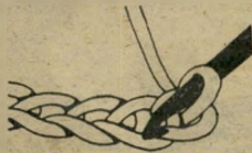
איך ללמוד סריגה בהתכתבות אם מישהו מצליח - זה שלו