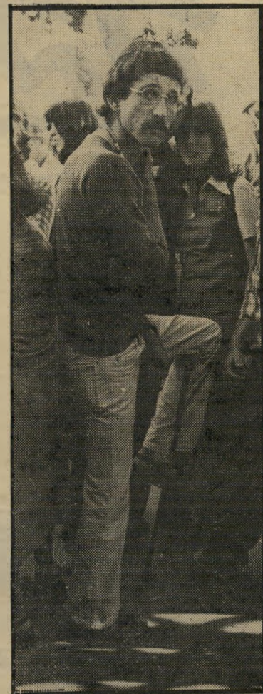
שֹׁאֲלֵי בְּהַלְוִיּוּת חֲבֵר יְדִידוֹת אֲמִיצָה

בְּרַגְעִים שֶׁבִּהֵם הוֹטַס שֹׁאֲלֵי ל־