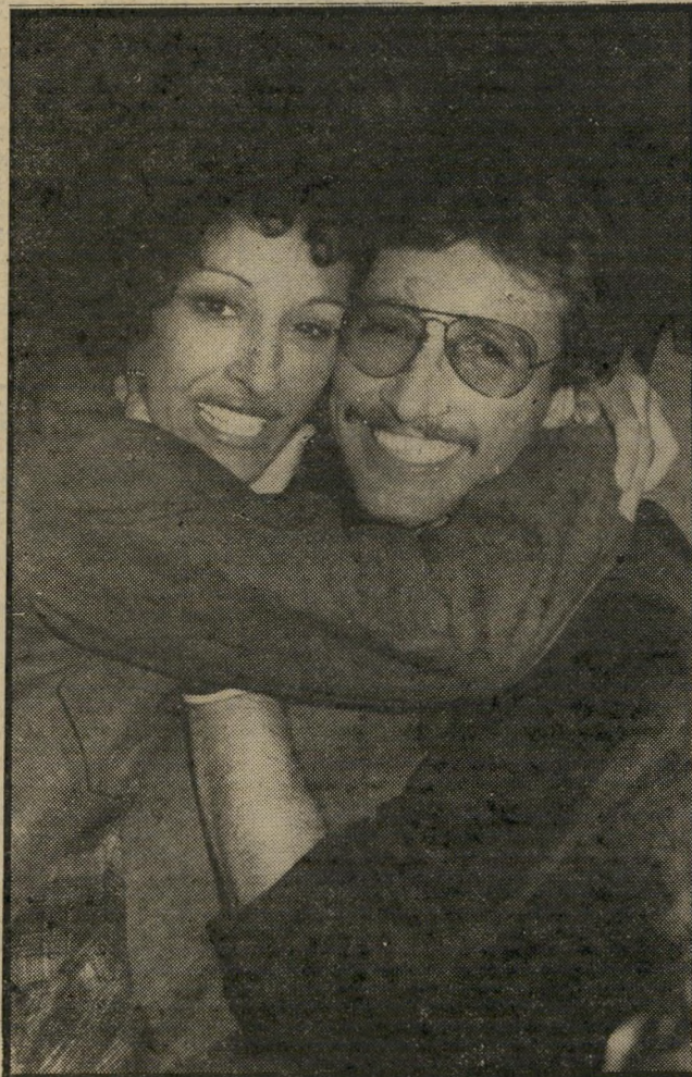
שֹׁאֲלֵי עִם שׁוֹשׁ עֶטְרִי הַצְּלָחָה עִם קַצֵּב

רוֹת וּלְפּוֹלִיטִיקָה. בֵּיתִיִּים אֵין גַּמְרֵי תִי עִם זֶה.“ יְדִידוֹ שֶׁל וִיִּצְמָן מֵאַרְצוֹת־הַבְּרִית, בִּינְיָהֶם עוֹרֵךְ־הַדִּין לִי