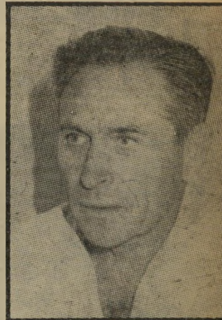
מתחרה רותם רק אוניה אחת

הגב הכספי של שבת. גם העובדה ששבת שינה ארבע פעמים את מיבנה החברה שלו, שהגישה את ההצעה, עורר חשש אצל ראשי החברה.