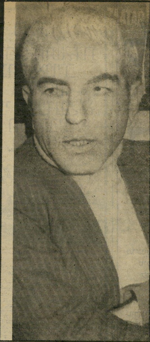
אישי-אש"ף אל-סרטאוי ב"מאנדי מורנינג" תעלול של שמעון פרס

By calling the Labor Party the only peace force in Israel, the Socialist International is de-throning all the bona fide peace groups in the Jewish state — an act which is beyond the mandate of any international body