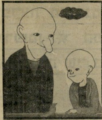
עולם אימים אקולוגי שד קטן של עשן

סיפורו של יפתח אלון הוא סיפור ה"חושף את עולם האימים האקולוגי ה"