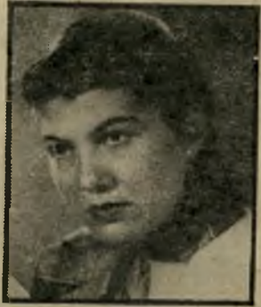
מדריכה תומא נישואי-תערובת

(המשך מעמוד 4) מדווחים היטב, ולפי הרבה ריאקי ציונרים אמיתיים הם מכבדים את כביסת-המערב המלוכלכת בפומבי ומצד שני: בדיוק אותם אנשים רעים של התיקשורת הבינלאומית גרמו, שנפגעי רעידות האדמה ב' אלג'יריה קיבלו עזרה מאסיבית ומיידית. כדבר אחד אני מסכים עם חיים ברעם: שחבל שאי אפשר (עדיין) להאשים את הסיידייאי באירגון שיטפונות, בצורות ורעידות-אדמה. שמתילב, שלמדור עולם קטן יש רצפט בדוק! לעולם לא לדווח על פרויקט חיובי, בארץ בעלה שילטון שלילי! תהרוג את הבחור, והוא לא יספר, שבאינדונסיה, למ' של, ישנם קואופראטיבים שמשל' ביים חקלאות ותעשייה זעירה. לא יאומן, אך יש להם בתי-יציקה