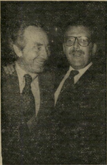
רוטשיורד (עם פרם) חיבוק הברון ליוני

ב יור הנמרי ששרי האוצר והתעשייה כלל את קראו את "חוק החברה לישראל", ואין להם מושג מהו הרכב הבעלות הנוכחי בה — או שהם מעלי-