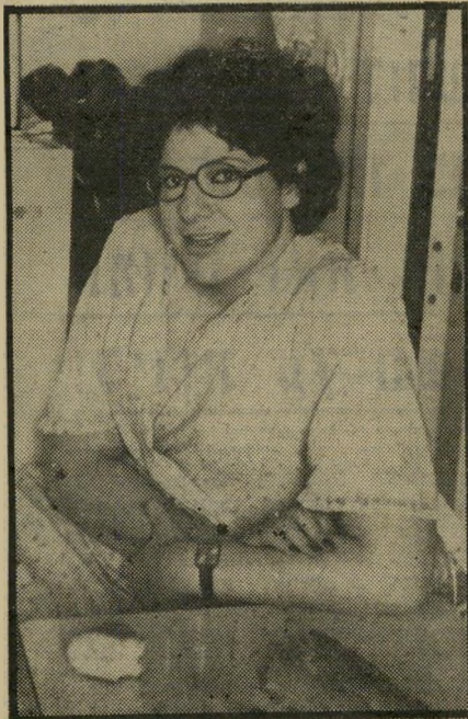
רזה היתה מרים רק כאשר היתה בת 18 וגם אז לא דקה במיר- חד. „אחרי כן התחלתי להשמיג.”