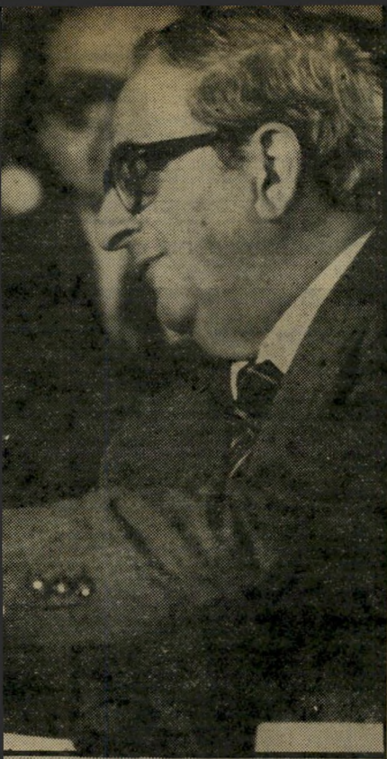
תיקון סכני נשיא המדינה, יצחק את אזוניותיו. כשעלר בפני מיטראן, אך פרס סירב. רק אחרי כן נל