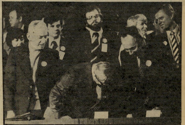
נבחר פרס, נשיא נכון ומזכ"ל ברי-לבי מי מוכר למי ומהיכן?

שהדירו בחודשים האחרונים שינה מעיניו. למחרת הוועידה נערכה ארוחת-ערב ב-מיסעדה סינית יקרה לאנשי המנגנון ולעוזרי-רים. ארוחת הניצחון. אבל כבר ליד הי-שולחן אפשר היה לשמוע את העסקנים העולזים מזכירים שמות של פעילי המפי-לגה. כל השמות היו של אנשי מתנה רבין.