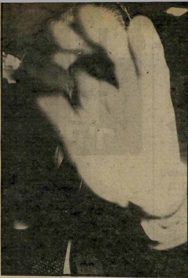
ציר צדוק מתנגד לציונים. צ"פ החוק אסור לצלם!

אין במדינה חוק האוסר ציי לום ברשות הרבים. אך צדוק ידע על מה הוא מדבר. על שולחן הכנסת מונחת הצעת חוק, להגנת הפרטיות, שצדוק עצמו היה אחד מיוזמיה העיקריים. הצעה זו באה לעשות, בין השאר, דבר שאינו קיים בשום מדינה דמוקרטית: לאסור את צילומם של אנשי ציי