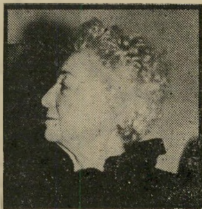
שחקנית פיקון — קולות

אסור להרוס, ואם בונה מישהו ללא רישיון, חייב מנגנון החוק לגלות פעילות ועירנות מבעוד מ"עד, כדי למנוע את הבנייה — אבל בשום פנים ואופן לא להרוס. נכון שאין להפלות טובה את ביתו של האמיד על פני ביתו של הדל, אך יש להטיל איסור המור על הריסת בית קיים כלשהו. במיקרה של גריי-בר אפשר היה להחרים תחת להרוס