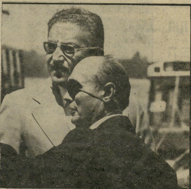
שרים לשעבר דיין ווייצמן מה הבטיח דיין ולמי?

שובל הזמין סקרי דעת-קהל ב"כמה מכוני-מחקר, הגיש את תוצאותיהם להורביץ. על פי סקרים