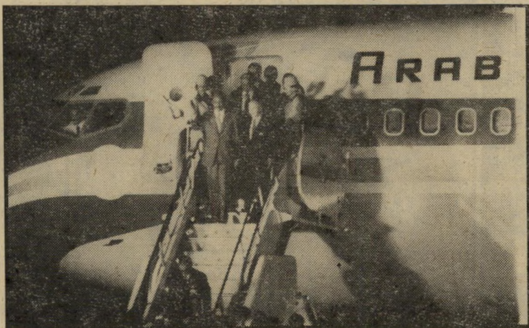
נשיא אל-סאדאת יורד ממטוסו זה היה חמש דקות לפני נחיתת המטוס

הישראלי הוא מילחמת-הדורות שבתוכו. כפי שמציג זאת המחבר: „תראה מה שקרה כליהאמר. זה היה הכל מיבצע שלהם, של האנשים הצעירים והמבריקים האלה. כן. אתה צריך לעשות הרבה