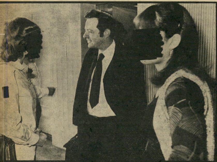
האשה, פרקליטה בצנזא הוכמן והפילגש של רגע, נעלה את המאהב

ת צהירה של האשה נתמך עלידי תצהיר שהגישה חברתה, המאהבת לשעבר של הבעל. היא רומזת בו על כך שלבעל היו יחסים גם עם נשים נוספות. האשה מסתייעת בתצהיר זה, שנתנה הר חיילת ברצון רב, כדי לזכות בתביעה שהגישה נגד בעלה. האשה הפילגש-לשעבר אף הגיעה לדיון המישפטי ביחד, כשזרועותיהן משולבות זה בזה. הבעל התבונן בשתיים, שכרתו ברית נגדו, ושק. "אני מכירה את הבעל מאז חודש יוני