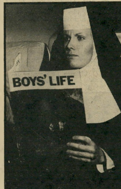
נזירה קוראת במטוס על חיי ילדים