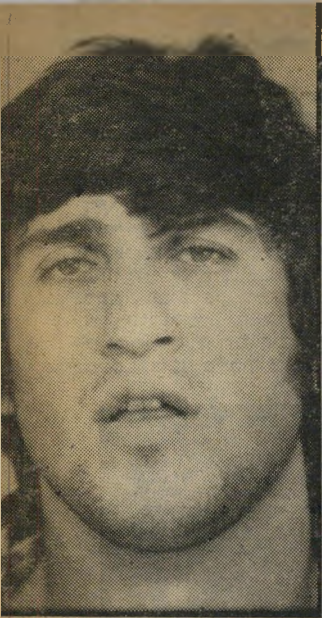
נרצה פנדו סימטה ביפו

תם הנגדיית של טהראני ואשתו. "גברת טהראני" שאלה הסניגור רית בקול חביב, "האם נכון ש' בעלך ושאלתי הגיעו במוצאי שבת, שבע לפני הרצח, ובעלך העיר אותך מאוחדת מאוד, ובעלך העיר אותך וביקש שתעשי קפה ואמר, חיסלנו