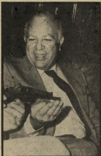
חוקר קרתי חשדות חמורים

המסיבה האחרונה בצריף, שבה השתתף ארבל, היתה כבר אחרי שנפתחה החקירה נגדו. לארבל, שידע על החקירה, הודלף מידע כוזב, כאילו החקירה לא העלתה דבר. עד היום לא ברור אם מידע זה הודלף בכוונה על-ידי הגורמים שעסקו בחקירה, או שהוא היה בגדר שמועת-שווא.