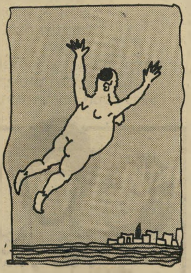
הרב פרוש, רוכב ככורו עוקה השמימיה

אני באמת לא מבין אותך, ח"כ מנחם פרוש. אתה דווקא צריך שאחרי שכבר לא תהיה רוח חיים באפך, תהיה שם רימה ותולעה? מה איכפת לך, תהרוג אותי אם אני מבין, מה יעשו לחתיכת הבשר שתישאר ממך אחרי המוות? אתה מתבייש במשהו? יש לך איזה גנם שאתה מפחד שהרופאים יראו, ואחריכך יפגע מקומך בהיסטוריה? כל-כך חשוב לך העניין, שאחרי המוות תשכב הגווייה שלך שבע אמות באדמה, ותסבול מכל שינוי מטופש במזג האוויר, מכל נחיל