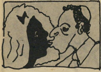
בחר יהודי טוב מתחתן עם השווארצע שיקסח