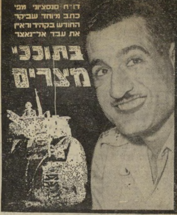
"העולם הזה" 947 תאריך: 8.12.1955