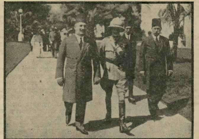
הנסיך מווייט עם המזך פואר (אבי פארוק) "עליונות הגרמנים והבריטים על יתר העמים"