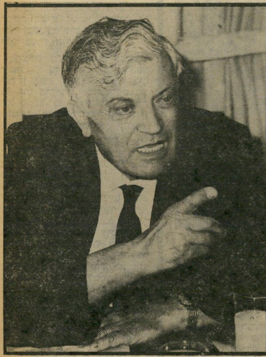
עד בוכוויץ אייסכמה לצו