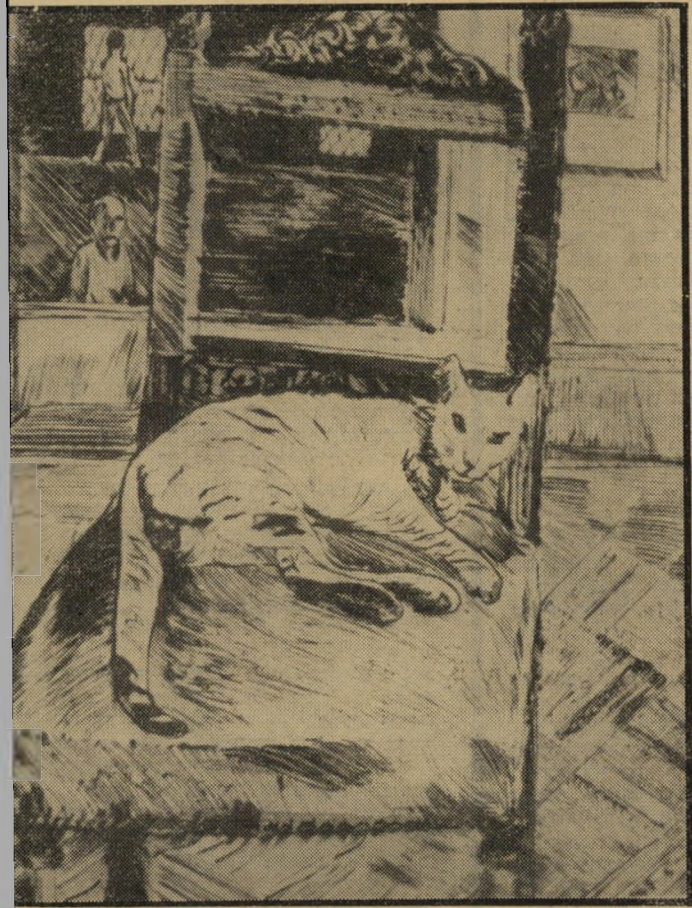
"חתול" (תחריט לא ממוספר של בורן) הציורים הם הבנים

בגלריה פארק המפוארת והיוקרתית, שדרך כלל אינה עורכת תערוכות-יחיד ומסתפקת בתצוגת האוסף היקר שלה (ובתוכו קיס' לינג, קיקואין ופאסקו). הועמדו שתי קומות לרשות קרן ראובן רובין, שדאגה לקבץ את כל היצירות מכל העולם. הקהל הרב המתדפק על דלתות הגלריה, ברובו אנשי הדור הישן וארץ-ישראל של פעם, מתרגש מציוריו של אחד מגדולי הציור הארץ-ישראלי. אור עז בוקע מציוריו של העולה מ'רומניה, שידע לצקת את אורה של ארץ-ישראל אל הבדים הגדולים ויחיים שלו. בניגוד לחבריו הציירים מאותה תקופה, שכולם כאחד הביאו איתם את מסורת הציור הי'אירופי, ולא היו יכולים להשתחרר מהצבעים הכהים והאטומים בציוריהם, הרי רובין היה משורר הארץ בצבע. לא לשווא זכה לי'מאמר תישבחת שכתב עליו ה'משורר חיים נחמן ביאליק. הלה הגדירו כאמן שזכה במשיכת מיכ'חול אחת לקנות את עולמו, ולהק'נות למתבונן בציוריו את הסוהר והזר, שהם סודו האישי.