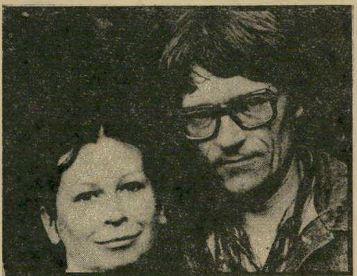
יוליוס טומין השמחות בנוסח ז'דנוב

יתכן מאוד שבסופו של דבר תפלוש ברית-המועצות לתחומי פולין, ותחסל את האביב הפולני, את האיגודים המיקצועיים החופשיים, ואולי אפילו את מזכיר המפלגה החדש, סטאניסלאב קאניה. אם תתרחש טרגדיה כזו, יפול חלק ניכר מהאחריות גם על נשיא צ'כוסלובקיה, גוסטב הוסאק, הלה, שהיה