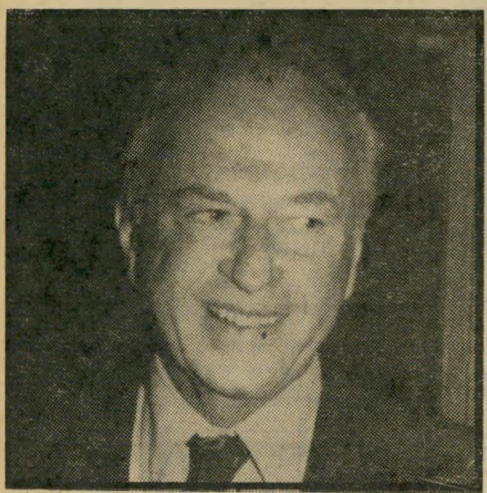
ח"כ יצחק רבין פרקליט מתאים