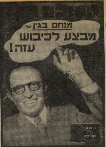
"העולם הזה" 946 תאריך: 1.12.1955