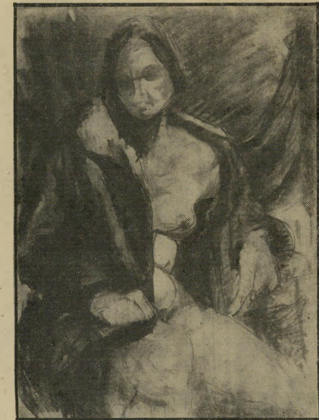
אשה בעירום של פרלמן — או תיאור של קונספציה

בגלריה הקטנה בזמן התצוגה, אכן תכתוב. בשנים האחרונות, מסיבות לא ברורות, שחלקן נעוץ מן הסתם בקידומה של המתירנות הישראית, מגמת הביקורת האמנותית לית, היא "דריסה קטלנית", או, במיק" רה הטוב — תיאור קונספציה. ניסוחה הקונסטרוקטיבי הידיעני (המשך בעמוד 8)