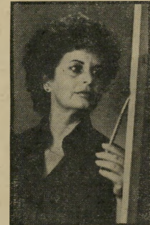
ציירת פרלמן — דיסה קטלנית