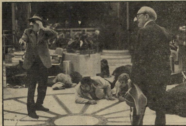
ברנס ושטראסבורג שודדים בנך הפנטיונרים בהרפתקה

חרווה עילאית. כימעט ענק ליד שני ידיריו הקטנים, כבד־גוף ומסורבל לכאורה, קארני הופך את אל, המוזג בדימוס שאותו הוא מגלם בסרט זה, לבחור הטוב שמוכן להצטרף לכל הרפתקה, אלא שבגילו אין מציעים לו יותר הרפתקות, עד אשר צץ רעיון השוד המצחיק בראש ידירו הישיש. לראות את קארני כשפניו סמוקות מהתרג־שות, מהמר ליד שולחן בלאס־וגאס עם הממון הגנוב, ולעקוב אחרי המבוכה הנרי־גשת שלו כאשר צעירה נאה מאוד (ומקצור־עית מאוד), "עושה לו עיניים", זה לראות שחקן שיועד לשלוט בכל גונו המקצוע. וכאשר הוא מקפץ על מידרכת מרכז רוק־פול לצלילי תזמורת־רחוב, מתחשק גם לצופה להצטרף לכיטיי החדווה העילאית הזאת של אדם, המגלה כי אינו צמח ואינו קישוט בחלון, אלא יצור חי ותוסס.