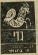
ג'מני 21 בינואר - 19 בינואר

תקופה שבה אתם חשים רצון לנוח ולתכנן את עתידכם בשקט. מוטב לא להצהיר ברבים על ה"תוכניות לעתיד הקרוב ולבצע אותן בשקט. היו זהירים בענייני כספים - התקופה לא מתאימה להימורים וסיכונים כספיים. מיכשולים מפי"תיעים ובלתי-מובנים עלולים לצוץ לפתע, ותזדקקו לאהדה ותמיכה, שלא תמיד ימהרו להגיע בתקופה זו. בשטח האהבה הדגש יהיה למרות טיבעכם, על יחסים סודיים.