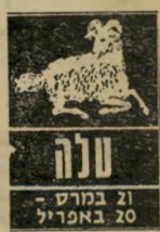
טלה 21 במרץ - 20 באפריל

התקופה המתקרבת תשפר את הר"גשיתכם. קשרים עם ארצות אחרות, או תוכניות לנסיעה ארו"רענן, ויוציאו אתכם ממצב-הרוח הקשה ש"בו הייתם נתונים. גם בשטח הרומנטי תחול התקדמות. במקומות בילוי תוכלו לפגוש ידידים, שבזכותם תכ"רו בני-רוזוג חדשים, שיוסיפו עליות ושימ"ה מבחינה כספית רצוי לשמור כל תוכנית בסוף. הפירסום עלול להזיק.