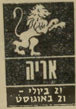
אריה 21 ביולי - 21 באוגוסט

תקופה פוריה במיוחד בכל המובנים. ענייני הכסף משגשגים, וכדאי לנצל כל הזדמנות כדי לשפר את המצב הכלכלי. זמן טוב להציע פר"יונות ותוכניות לאנ"שים. כטריח כדאי לנ"רש. חיי החברה מה"ים ומספקים. גם ל"דים מוסיפים נחת ושימחה לתקופה. יח"סים רומנטיים חדשים יביאו אתכם למקומות בילוי שבהם לא נראתם זמן רב. תיכננו לטווח-ארוך לא יראה תוצאות מיידיות, נסו להנות ולמצות כל רגע טוב עד תומו.