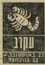
עקרב 22 באוקטובר - 22 בנובמבר

העקרבים, שחשו יובש ובצורת בשטח האהבה, יוכלו להתעורר ולהעזר בכל חמשת החושים על-מנת להנות מתקופה פוריה במיוחד. המגנטיות ש"תקרון מכם, תמשוך אליכם אה בני החי"השני. קשה יהיה להת"עלים מכם, וגם אתם תהיו סוף-סוף שבעי"רצון ושבעי-אהבה. עבר"דה רבה מצפה לכם, אך ברגע זה התנו מכל מלאכה מכיוון שהפיצוי, שתקבלו בזמנכם הפנוי, יוסיף מרץ ושימחת-חיים לעיסוק.