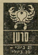
מרגו 21 ביוני - 20 ביולי

עומם עבודה מכנים מתח רב לתקופה. יש להשגיח על הבריאות - מיתושים שונים מציקים, והר"גשה לא נוחה. תזדו"קצר הרגשה זו תח"לף ותחזור שוב לנ"מכם. יש להיזהר בכל מה שקשור להשקעות כספיות או הלוואות. נטייה ללכת לקיצוניות עלולה לגרום הפסדים ממשיים. יש להקטי"ן את הסיכון עד כמה שאפשר, ולהתייעץ עם אנשים מיקצועיים.