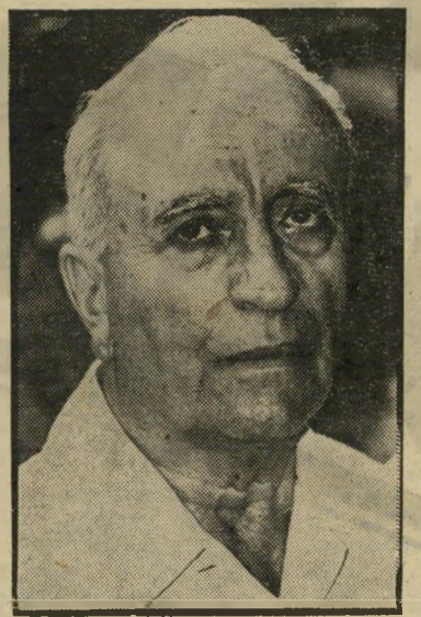
ירוחם משך חוש לצדק

סופו ומטרתו. היכולת לראות מכה"משותף בתופעות שונות, נותנת להם את האפשרות להבין שפה סימבולית רחנית. זו הסיבה שרבים מהם נמשכים אל הפילוסופיה ואל האמונה. הם נהנים מתרגילים אינטלקטואליים, בתנאי שה"דבר יעזור להם להבין טוב יותר את מהות-החיים. זה לא מונע מבעדם להת"ה