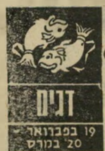
דגים 19 בפברואר - 20 במרץ

תקופה שבה עליכם להיזהר מחברים מתוסכלים שטובדים אתכם. הם עלולים לבקר אתכם קשות, ולהתנכל לכם. נסו לנ"הוג רק לפי החוק ולא לסעות ולא לאפשר לאחרים לבקר אתכם. כדאי למעט בחיי חברה ולא לחשוף עצמכם ל"דיבורים. שינוי פתאומי ואולי דרסטי בתנאים, מועיל בסופו של דבר, אבל זה עשוי להיות קשה מעט, ומצריך הסתגלות מהירה.