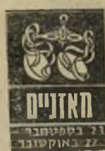
האזניים 21 בספטמבר - 22 באוקטובר

רצון לשינוי ממריץ אתכם לתכנן תוכ"ניות חדשות, שלא זה הזמן להעזר בהן. היכריות חדשות ומר"שימות יביאו עימן מצבר-רוח אופטימי, ני"נוח ושלו. ידיד, ש"יגיע לביקור מחוץ"לארץ, עשוי להביא עימו רעיונות משונים ומבדחים. בשטח ה"עבודה העניינים מתנה"לים לשביעות-רצונכם, אנשים רבים מתפעלים מהצורה היעילה של ביצוע עבודתכם.