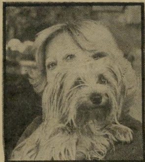
שרה וזונה חיי כלב —

מה תוארו הרשמי של ה' מלך, ששמו הוזכר במדור "אנשים" ("העולם הזה" 2253)?