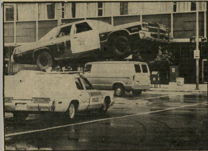
ה"בלוזמוביל" מזנקת מעל ניידת-מישטרה (ברחוב כשיקאגו) מוצג מוסיאונרי

ביום אחד נדרשו מאות רקדנים כדי למלא את הללו של רחוב, מול הנות כלי-נגינה שבה מדגים ריי צ'ארלס מה אפשר להפיק מאורגן חשמלי צנוע. ביום אחר מקבצים מאות מכוניות מישטרה מהבהבות, שיוצרות שיירה אינסופית על הכביש, רודפות אחרי הבלוזמוביל של שני האחים, ולבסוף נכנסות זו בזו ונמערות, אחרי שהחליקו על הגג עם הגלגלים למעלה או עברו כברת-דרך על שני גלגלים בלבד, ברזל מכה בברזל, פחים מתוכר-פחים, פנסים מתעופפים, שמשות מתנפצות, ושוטרים זוחלים מתוך ההריסות, מבלי שאזנה להם כל רע. הטענה החמורה ביותר של אחד מהם היא: "הם שוב שברו לי את המשקפיים."