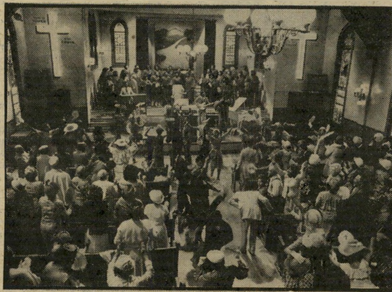
רוק בכנסיה באפטיסטית בהדרכת ג'וימס בראון כל השיגיונות וכל השיגעונות

דורל והארדוי. נמוך ועגלגל וגמיש להפליא חרף מימדיו (הוא מבצע כמה הייפוכים באוויר תוך כדי תפילה של מטיף דתי שחור), בלוזי הוא התגלמות האיש שאינו מבין מדוע צריך לעבור מבעד לדלת אם אפשר לעבור דרך הקיר, ואפשר לסמוך עליו, שבהינף יד הוא אכן יהרוס את הקיר כדי לעבור בו. אייקרוייד, לעור מתו, נראה כמעט כמו "נער אמריקאי