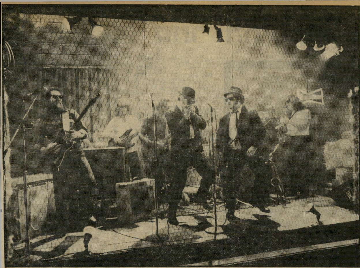
ג'ון בלוזי וזן אייקרוייד בתפקוד ג'ולייט ואלוד בלוז כסרט "האחים בלוז" להקת פופ בסערה תזוית

ברז מכה ברזה. בעיקבות ההצלחה המדהימה של הסרט, שהיה אחד הלהיטים