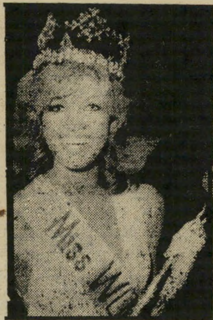
מלכת-יופי-מתפזרת ברוב שאלות מביכות

יש הטוענים שהיו אלה מתחריו של שוקי, בעלי מועדונים אחרים, שניסו לפגוע בו בצורה זו, או להזהיר אותו. אחרים יודעים לספר,