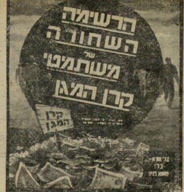
"העולם הזה" 944 תאריך: 17.11.1955