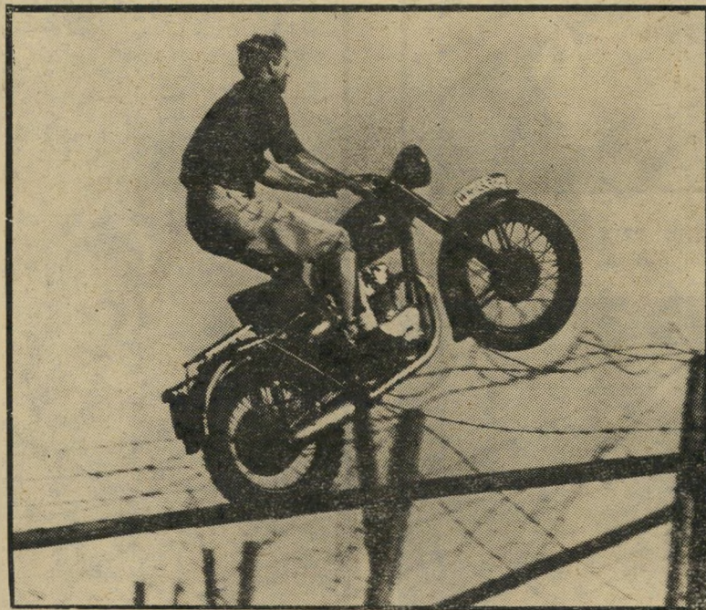
מקוויין כסירטו של ג'ון סטרג'ס, "הבריחה הגדולה" התמודדות עם הבלתי אפשרי

תום הורן והצייד, באותו המרץ שאיפיינו אותו מאז ומתמיד, וכשאלה ביקרו אותו ליד מיטת חוליו, שעה שכבר היה ברור כי אפסו הסיכויים להצלחה, אמר להם מק'קוויין: "אני לא אאותר, עד הרגע האחרון! אבעט ואצעק