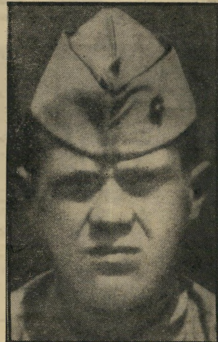
טוראי מק'קוויין ב-1947 נתונים שבעיים

מק'קוויין נולד בעיירה קטנה במדינת מיסורי, "את אבי לא היכרתי מעודי",