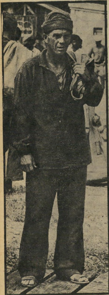
מק'קוויין ב"פרפר" שחקן מוכשר

הזמנה פרטית. אבל מק'קוויין היה יותר מזה, הוא היה שחקן מוכשר, שכעס לא פעם כאשר ניסו להלביש עליו שוב ושוב דמות שיגרתית, ככל שהתקדם הפך בררן גדול יותר, דבר שרבים פירשוהו כפינוק. הוא הקים חברת-הפקה משלו, והיה בין הכוכבים הראשונים שעשה זאת, לא במעט משום שקשה היה למצוא אולפן