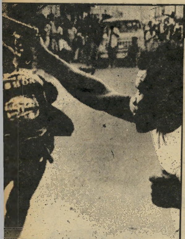
פלוגת הסדרן של סביאגה בפעולה ניצחון לדוד סאם

הסיפור האמיתי על איראן. רק אחרי נפילת השאה הגיעו לידיעת הציבור במערב הפרטים על זוועות מישטרו, על תעלולי הסאואאק ועל