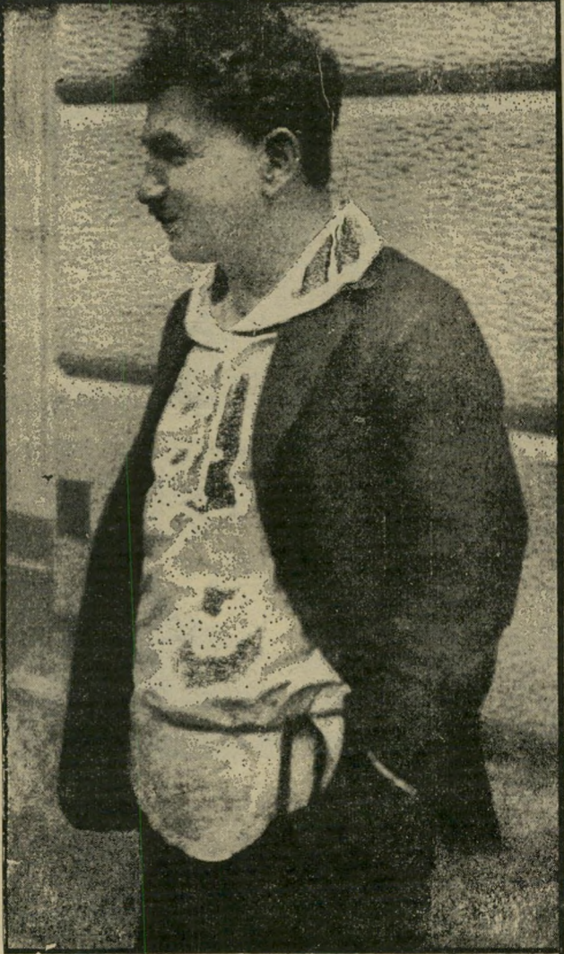
ברל כצנלסון ב-1930 הצל"ש

מ א ר ז ן : איש גבוה ורוח; (2) פקר-דה מפורשת; (3) הרבה בק-שות; (4) מתלה; (6) רקב; (7) היחידה שהקים "הייד" ללו-חמה בכנופיות הערביות; (8) אחד מפרד"ס; (9) מושב עוב-דים ליד נתב"ג; (12) שעווה או מוצר הדבורים (כתיב חסר); (15) רקבובית; (16) דד הש-דיים, הבליטה שבקצה השד; (17) מיתר בגוף החי; (19) הפ-רדה, הוצאת חלקים; (20) חל-קו הפנימי של גזע האילן; (21) הדור, מקפיד בלבוש; (23) יליד המקום; (24) אחוריים; (26) אחד ה"גששים" (ש"מ); (29) תן; (29) החושב ומקבל