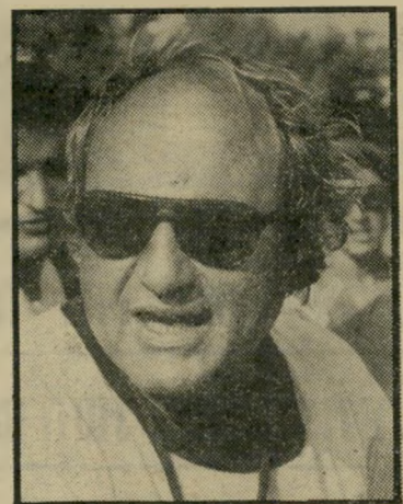
אמן יגאל תומרקין פורנוגרפי? בבקשה