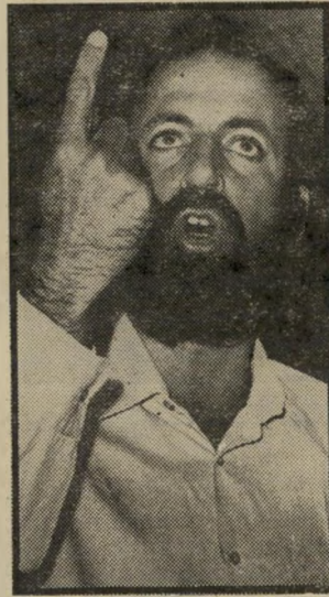
ח"כ נוף פרטית לגמרי

באולם המליאה יש רוב מיקרי נגד הצעתו. הוא ביקש מיושבי-ראש ה-ישיבה לדחות את ההצבעה, כדי שיוכל להעלות שוב נושא זה, כי שיהיה לו רוב.