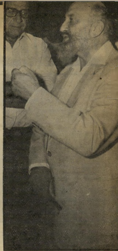
עורך-דין בסוק חצי מיליון - בתנאי...

עיקר מאמצי המישיטרה באו לגלות לאן נעלמו הכספים. בחקירתם של