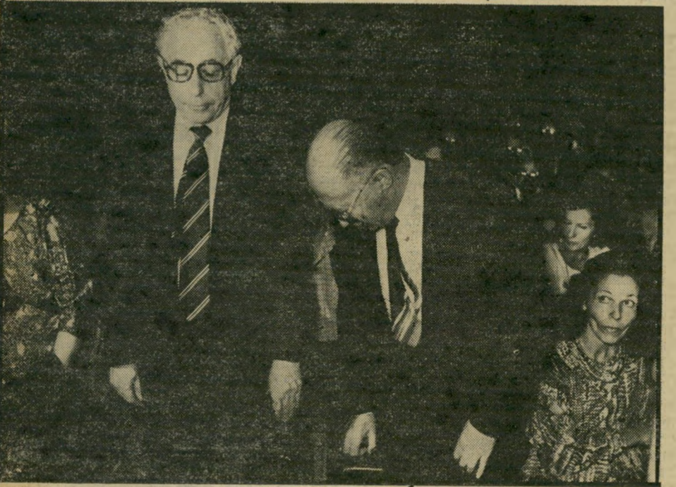
מנחם בגין אינו משתחוה ליושבי-ראש הכנסת, יצחק ברמן, למרות שזה נראה כך בתמונה. ברמן, שהושב ליד ראשי-הממשלה, מילא את מקומו של נשיא-המדינה יצחק נבון בעת ביקורו של זה במצריים. מנחם בגין התבונן בסך הכל בכיסאו, לפני שהתיישב עליו, בעוד שיושבי-ראש הכנסת ברמן חיכה שראשי-הממשלה יישב קודם, ורק אחרי זה התיישב גם הוא.