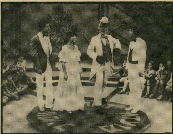
גודדבאט, דטנר, נחמיאס וזוי: החתול שמי יום שלישי, שעה 5.30

מיצעד הכוכבים עם ג'ימס לאסט ואורחיו (10.25) - תוכנית בידור.