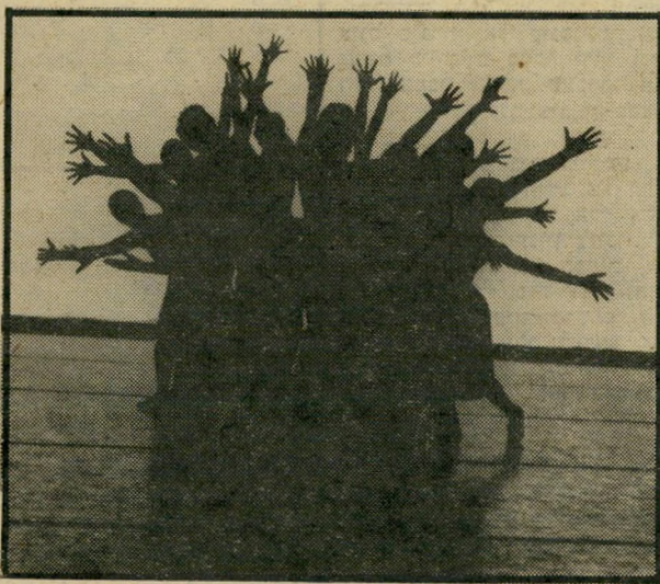
יצורי לילה: להקת בתי-דור יום חמישי, שעה 11.15