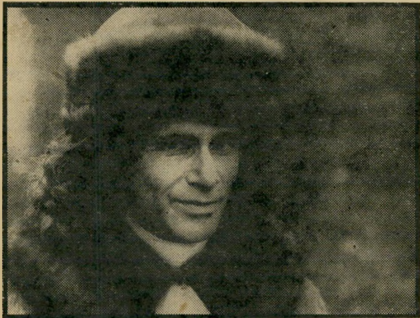
מנואל: וולטר יום שלישי, שעה 11.00

סידרה חדשה בת שישה פרקים, שתוקרן מדי יום שלישי, תספר בצרפתית את סיפור חייו של אחד מגדולי ההוגים, פראנץ סואמארי דא ארוא, המכונה וולטר (1694-1778). פילוסוף, סופר, הוגה-דיעות, עורך גלות ושב לצרפת עם מאהבתו. תוקף את המלוכה ונכלא בבסטיליה. הפרק הראשון של הסידרה (4.11) נושא את השם "השע-